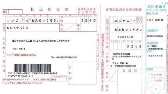
←払込票の参考画像

コンビニのレジで払込票を提出し、表示された金額を確認後お支払いください。 お支払い頂いた履歴は OB 会事務局で確認されます。 (郵便局でも払込票はご利用出来ます。)