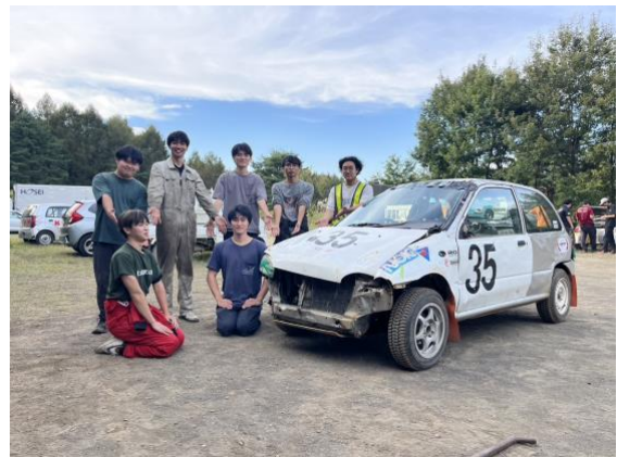
軽自動車6時間耐久レース