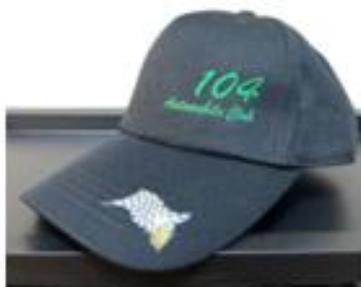
農友会自動車部キャップ