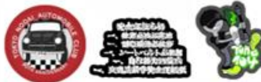
ステッカー3種セット