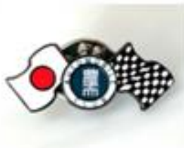
農大フラッグピンス